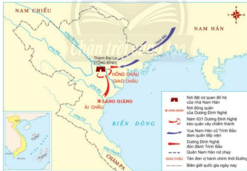
Hình 19.2 Lược đồ cuộc kháng chiến chống quân Nam Hán lần thứ nhất