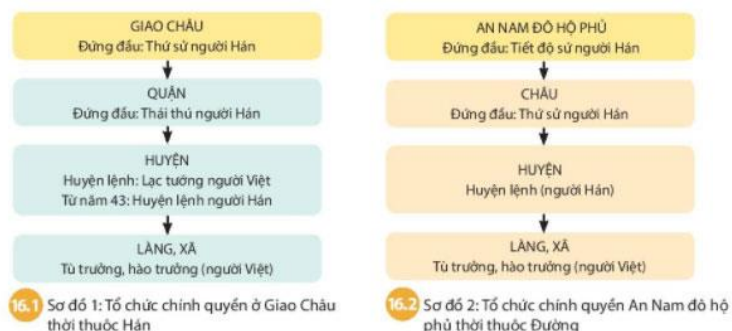
Hình 16.1 và 16.2