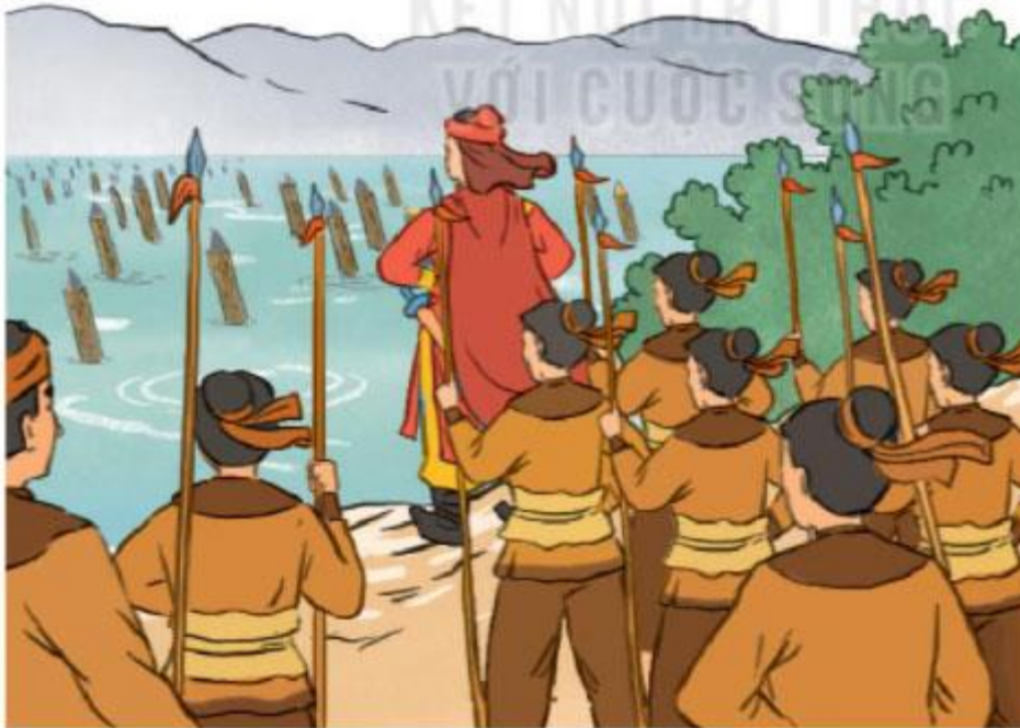
Hình 6. Mô phỏng trận địa cọc trên sông Bạch Đằng (tranh minh họa)