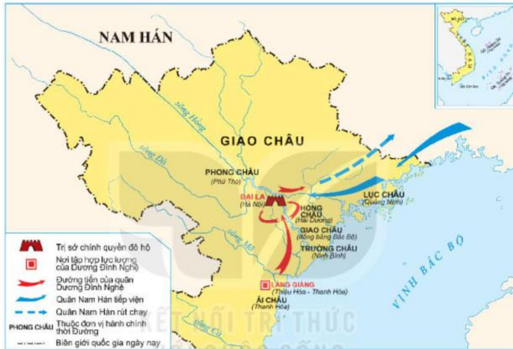
Hình 4. Lược đồ cuộc kháng chiến chống quân Nam Hán lần thứ nhất (930 - 931)