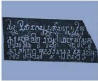
Hình 18.3. Bản dập chữ Chăm cổ (bia Đông Yên Châu, Trà Kiệu, Quảng Nam, thế kỉ IV)