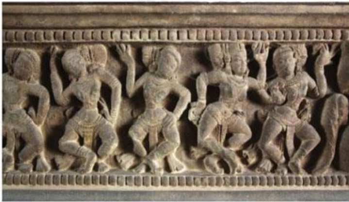
Hình 18.5. Hình trang trí trên Đài thờ Trà Kiệu (điều khắc đá, Quảng Nam, thế kỉ IX - X)

Gợi ý trả lời: Một số thành tựu văn hóa tiêu biểu của cư dân Chăm-pa: