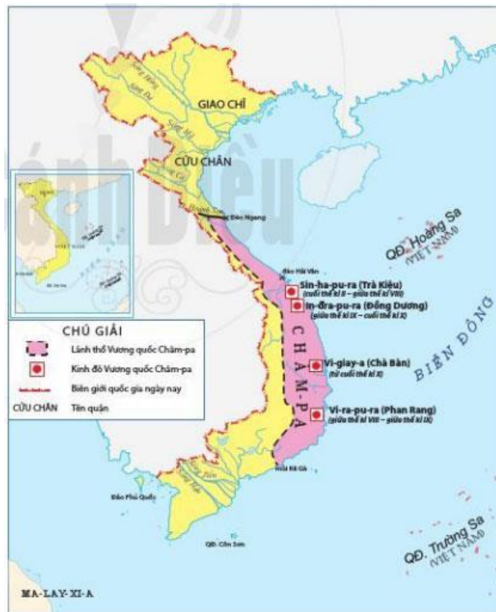
Hình 18.1. Lược đồ vương quốc Chăm-pa (thế kỉ II đến X)