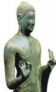
Hình 18.4. Tượng Phật Đồng Dương (tượng đồng, Quảng Nam, thế kỉ VIII - IX)