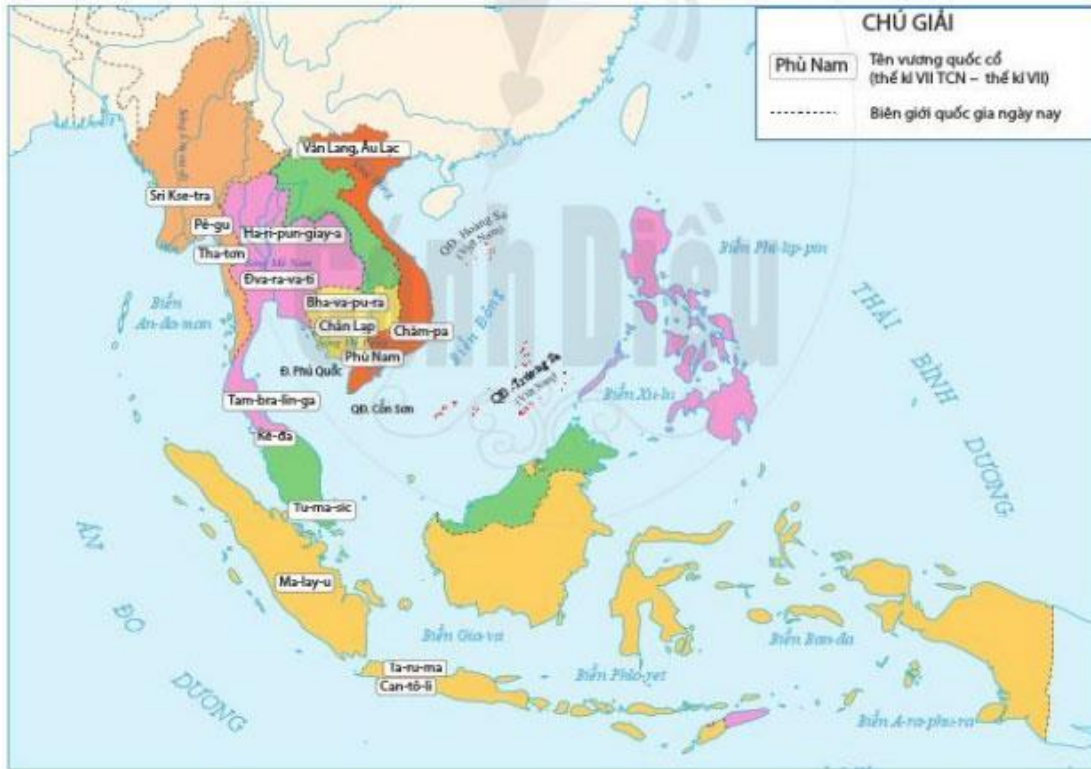
Hình 10.2. Lược đồ các vương quốc cổ ở Đông Nam Á (từ thế kỉ VII TCN đến thế kỉ VII)