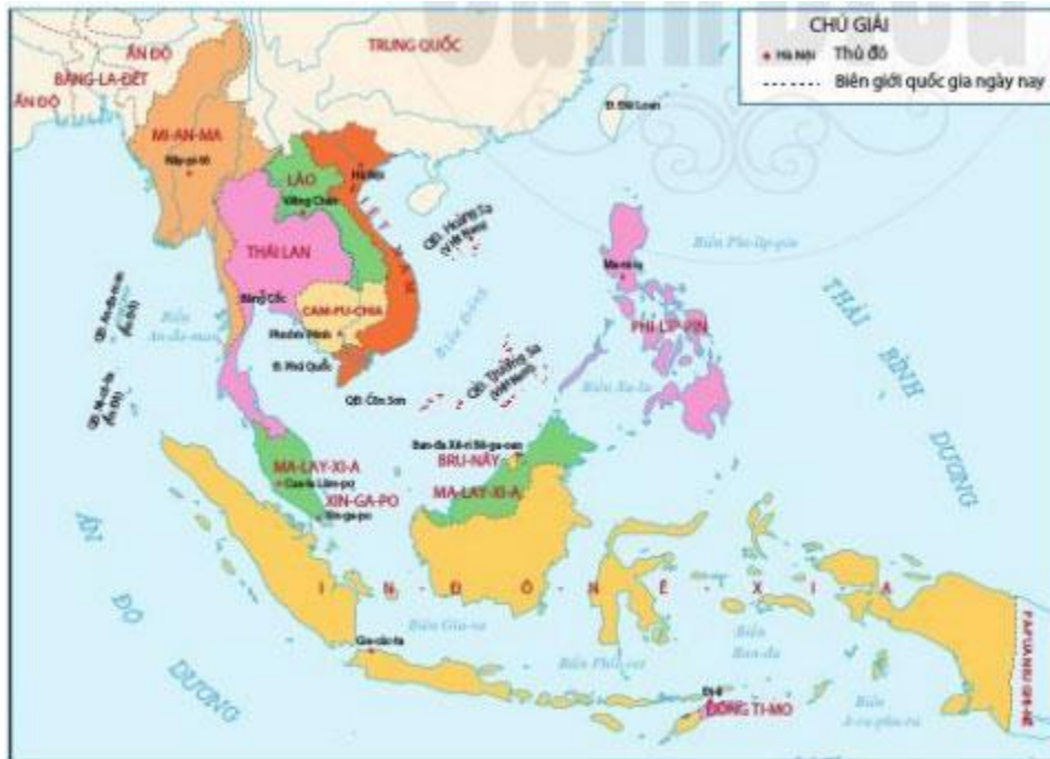
Hình 10.1. Lược đồ các nước Đông Nam Á ngày nay