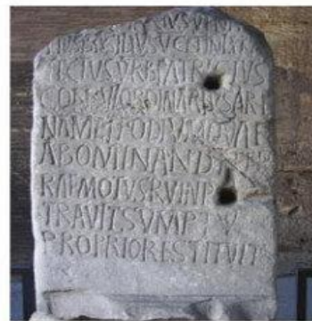
Hình 9.7. Văn khắc bằng tiếng La-tin ở đầu trường La Mã