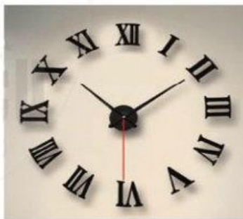
Hình 9.8. Mặt một chiếc đồng hồ sử dụng số La Mã