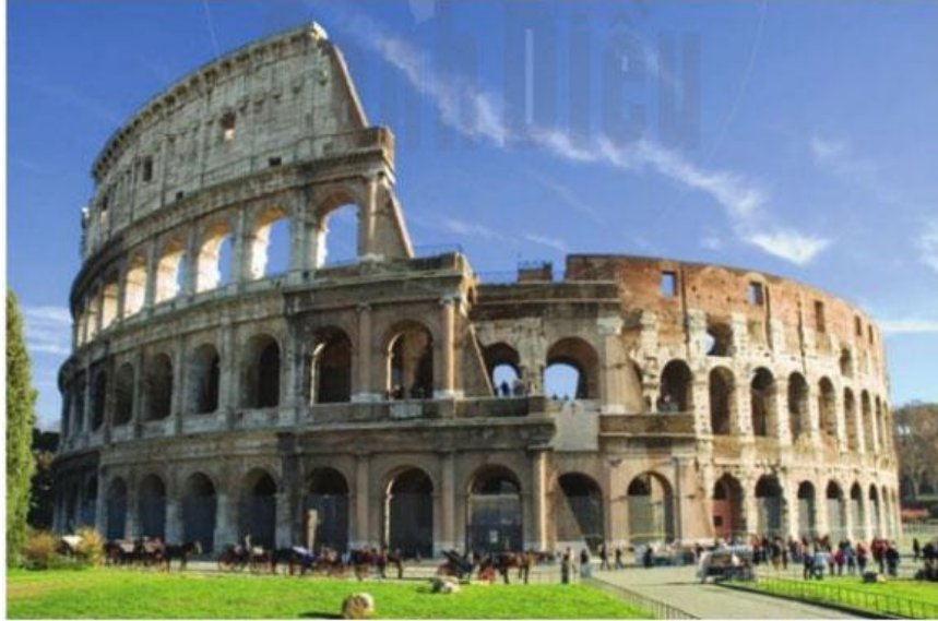
Hình 9.12. Đấu trường Cô-li-dê