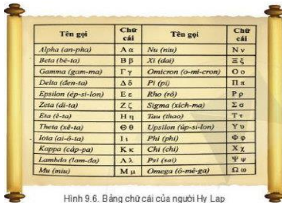
Hình 9.6. Bảng chữ cái của người Hy Lạp