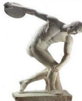
Hình 9.11. Tượng lục sĩ ném đĩa