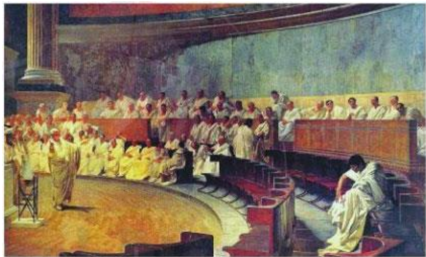
Hình 9.5. Một thành viên đang diễn thuyết tại Viện nguyên lão (tranh vẽ)