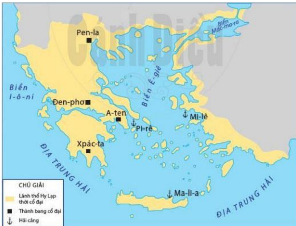
Hình 9.1. Lược đồ Hy Lạp cổ đại