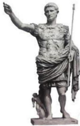
Hình 9.4. Tượng Ô-gu-xtu-xơ