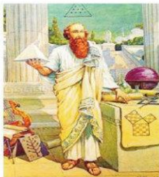
Hình 9.10. Tranh vẽ nhà toán học Pi-ta-go