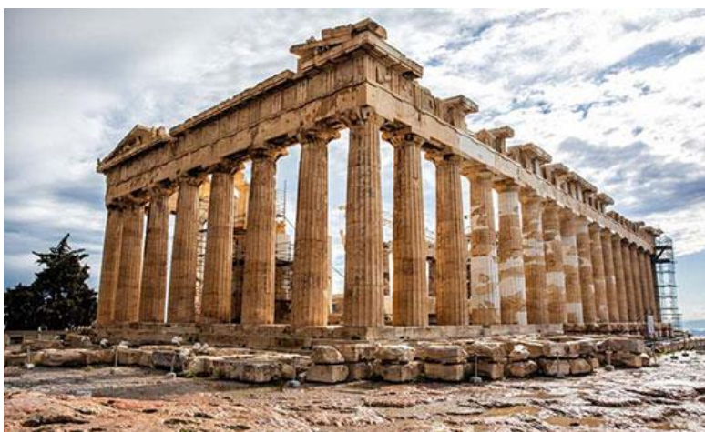
Đền Parthenon - kiệt tác kiến trúc của văn minh nhân loại

Vào năm 1975 chính phủ Hy Lạp bắt đầu bàn tính về việc cho xây dựng lại công trình này. Dự án này đã thu hút được rất nhiều sự trợ giúp về kỹ thuật và tài chính từ liên minh Châu Âu. Tuy nhiên mối đe dọa lớn nhất đối với đền Parthenon hiện nay là môi trường.