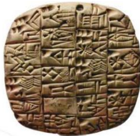
Hình 6.7. Chữ hình nêm viết trên đất sét của cư dân Lưỡng Hà