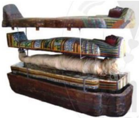
Hình 6.4. Xác ướp Ai Cập cổ đại