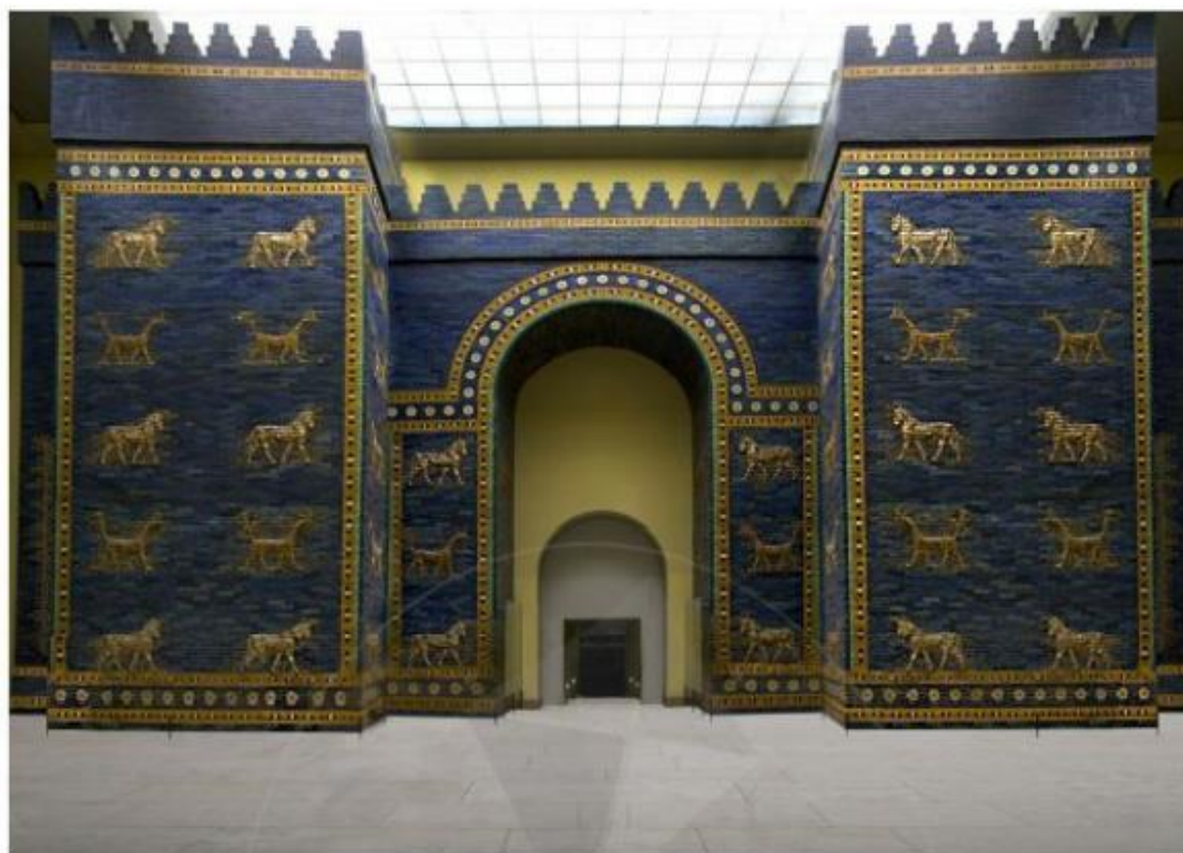
Hình 6.9. Cổng I-so-ta - cửa ngõ dẫn đến trung tâm thành phố Ba-bi-lon (bản phục dựng)