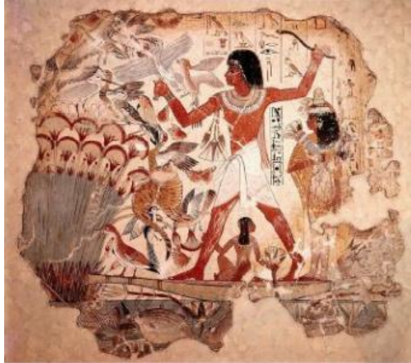
Hình 6.2 Một người Ai Cập đang săn bắt chim trên sông Nin