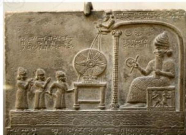
Hình 6.5. Bảng đá khắc hình thần Sa-mát (thần Mặt Trời) ở Lưỡng Hà