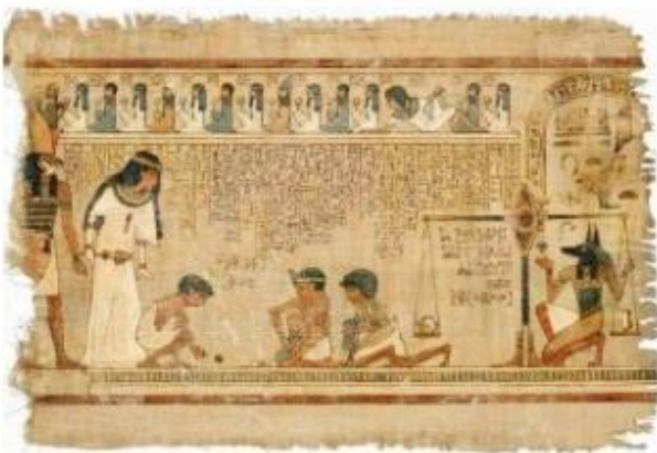
Hình 6.6. Chữ viết trên giấy Pa-pi-rút của cư dân Ai Cập