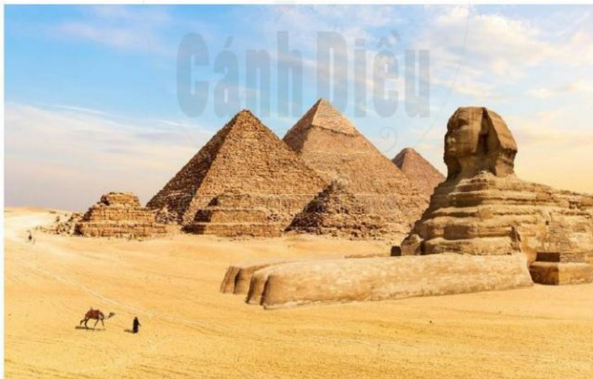
Hình 6.8. Quần thể kim tự tháp Gi-za và tượng Nhân sư (Ai Cập)