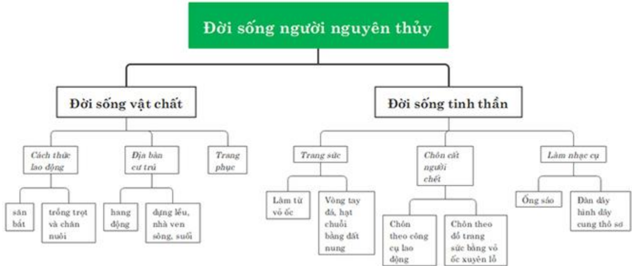
Sơ đồ tư duy đời sống người nguyên thủy (Mẫu tham khảo)