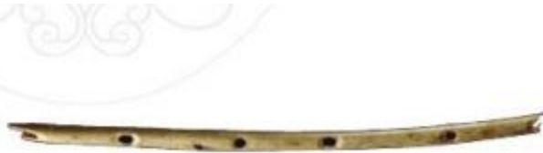
Hình 4.11. Sáo bằng xương chim (Đức, khoảng 40 000 năm trước)