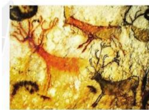
Hình 4.1. Bích hoạ động vật trong hang An-ta-mi-ra