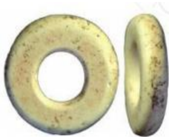
Hình 4.10. Đồ trang sức bằng vỏ trứng đã điều chế (Nga, khoảng 50 000 năm trước)