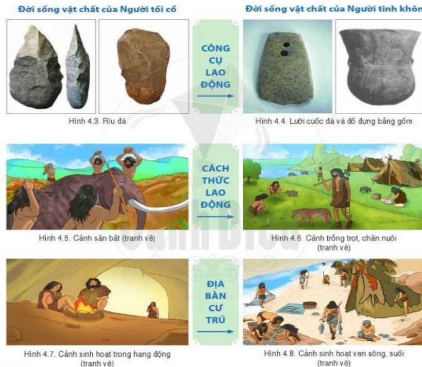
Hình 4.3 - 4.8 Đời sống vật chất của người nguyên thủy