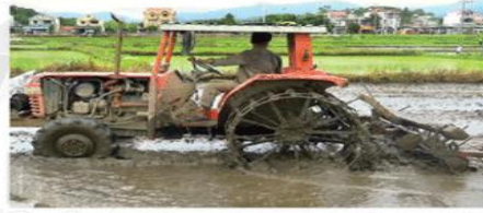
Hình 1.4. Nông dân cấy ruộng (thời Đổi mới)