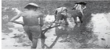
Hình 1.3. Nông dân cấy ruộng (thời Pháp thuộc)