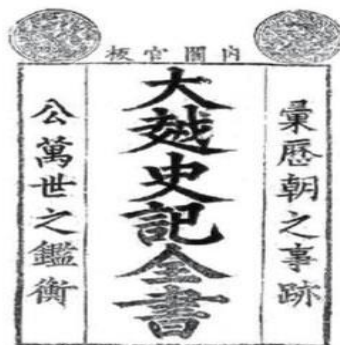
Hình 1.10. Cuốn Đại Việt sử ký toàn thư (bản in Nội các quan bản, 1697)