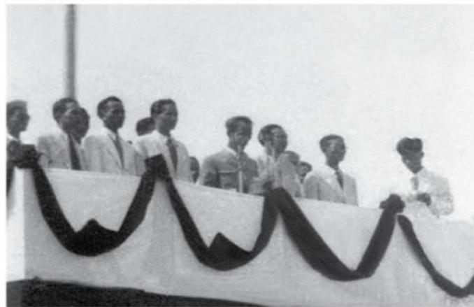
Hình 1.7. Chủ tịch Hồ Chí Minh đọc bản Tuyên ngôn Độc lập tại Quảng trường Ba Đình, Hà Nội (2-9-1945), thành lập nước Việt Nam Dân chủ Cộng hoà