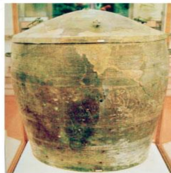
Hình 1.9. Thạp đồng Đào Thịnh (Vân hoá Đông Sơn, khoảng 2 500 – 2 000 năm trước)