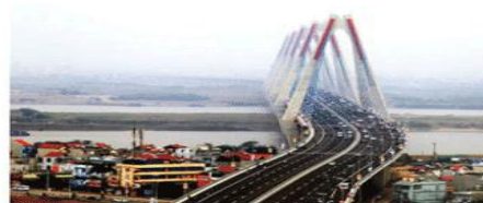
Hình 1.6. Cầu Nhật Tân, Hà Nội (xây dựng từ năm 2009 đến năm 2015)