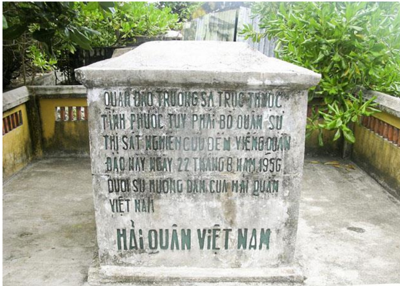
Hình 1.12. Bia chủ quyền quần đảo Trường Sa tại đảo Nam Yết (Khánh Hòa, Việt Nam) được công nhận là Di tích lịch sử quốc gia vào năm 2014