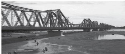
Hình 1.5. Cầu Long Biên, Hà Nội (xây dựng từ năm 1898 đến năm 1902)