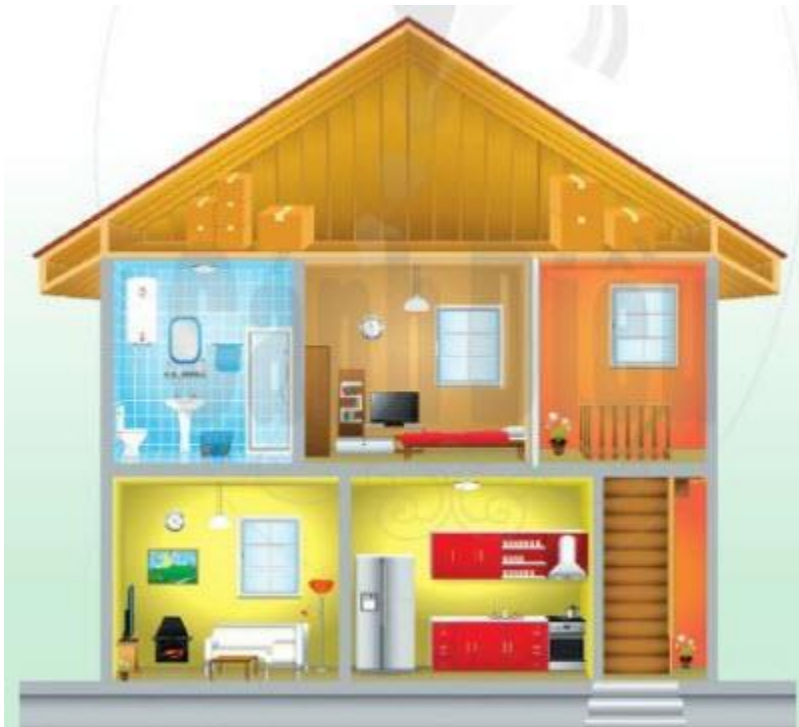
Hình 1.3. Nhà ở của con người thời kỳ hiện đại

Câu 1. Hình 1.3 thể hiện các vai trò nào của nhà ở?