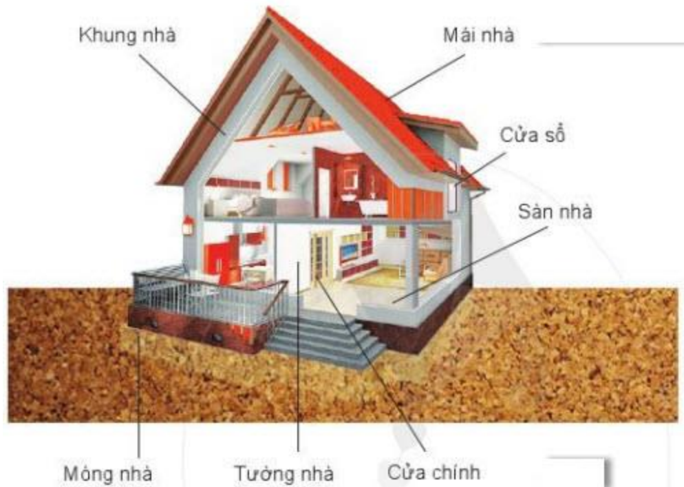
Hình 1.4. Các phần chính của nhà ở