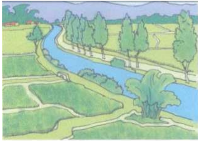
① Trước kia

+ Theo bạn, hình 1 và 2 cho biết con người sử dụng đất trồng vào những việc gì?