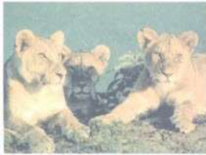
5 Sư tử