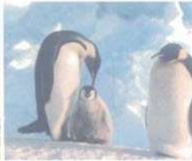
6 Chim cánh cụt