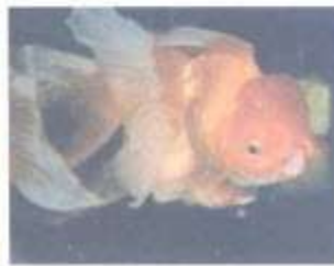
8 Cá vàng