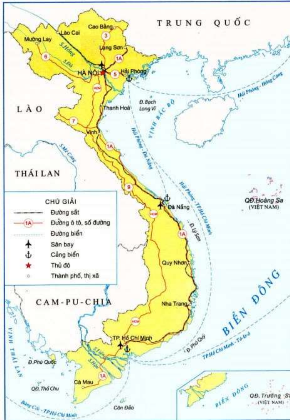
Hình 2. Lược đồ giao thông vận tải