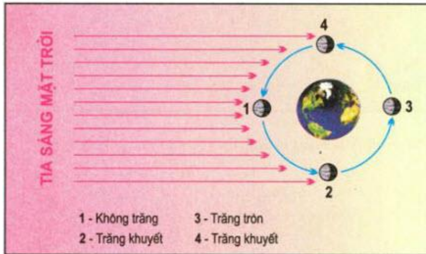
Hình 16.1 - Chu kì tuần trăng

Dựa vào hình 16.1 (SGK trang 59) và hình 16.2 (SGK trang 60), hãy cho biết vào các ngày có dao động thủy triều lớn nhất, ở Trái Đất sẽ thấy Mặt Trăng như thế nào?