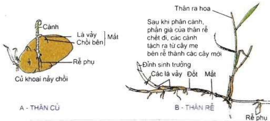
Hình 41.2. Một số hình thức sinh sản sinh dưỡng tự nhiên của thực vật