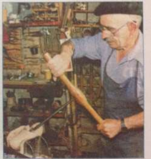
Hình 24.2 - Làm nghề thủ công trong một vùng núi ở châu Âu