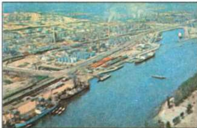
Hình 15.4 - Cảng Duy-xbua trên sông Rai-nơ (Đức)

Quan sát về cảng sông Duy-xbua (Đức) và sơ đồ của cảng, phân tích để thấy sự hợp lí trong việc bố trí các khu dân cư (chú ý các mũi tên chỉ hướng gió và hướng dòng chảy).