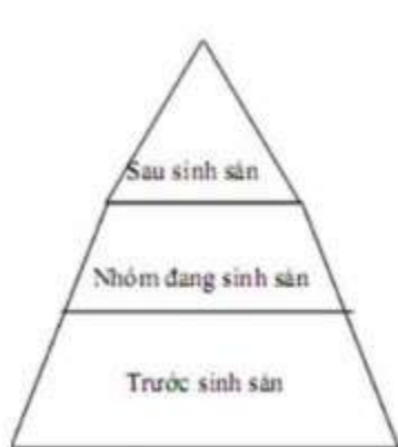
Tháp tuổi của chim trĩ

- Hình tháp của nai có dạng giảm sút. .( Nhóm trước sinh sản \leq Nhóm đang sinh sản \geq Nhóm sau sinh sản)