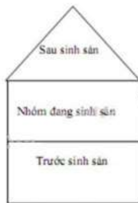
Tháp tuổi của chuột đồng