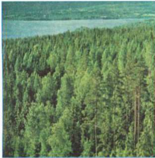
Rừng của Thụy Điển vào mùa xuân

Dưới đây là ảnh các kiểu rừng ở đới ôn hòa: rừng hỗn giao, rừng lá kim, rừng lá rộng. Xác định từng ảnh thuộc kiểu rừng nào.