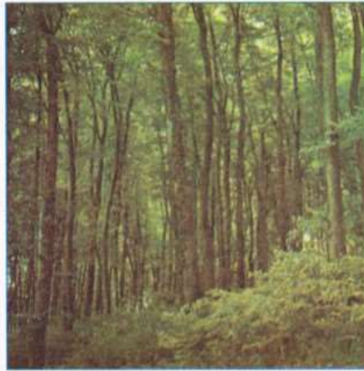
Rừng của Pháp vào mùa hạ