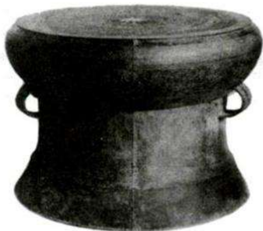
Hình 37 - Trống đồng Ngọc Lũ (Hà Nam)