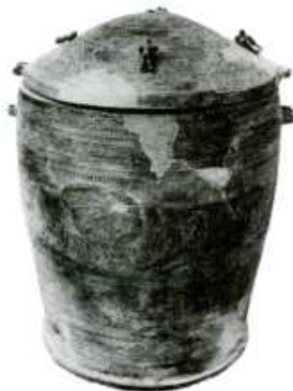
Hình 36 - Trống đồng Đào Thịnh (Yên Bái)

- Theo em, việc tìm thấy trống đồng ở nhiều nơi trên đất nước ta và cả nước ngoài đã thể hiện điều gì?