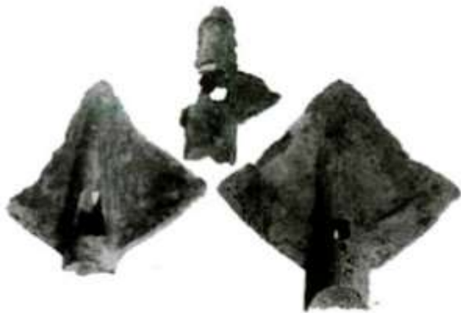
Hình 33 - Lưỡi cày đồng

- Qua các hình ảnh ở bài 11, em hãy trình bày người dân Văn Lang xới đất để gieo cấy bằng công cụ gì?