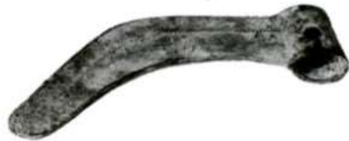
Hình 34 - Lưỡi liềm đồng