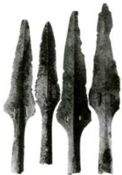
Hình 31 - Mũi giáo đồng Đông Sơn

- Sự xuất hiện của nhiều loại vũ khí (hình 31,32 – SGK, trang 34) nói lên điều gì?