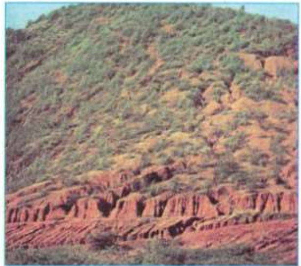
Hình 9.2 - Đất bị xói mòn