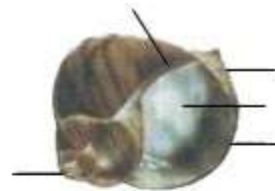
Hình 20.2. Mặt trong vỏ ốc 1. Đỉnh vỏ; 2. Mặt trong vòng xoắn; 3. Vòng xoắn cuối; 4. Lớp xà cừ; 5. Lớp sừng (ở ngoài)