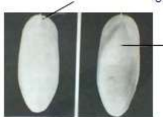
Hình 20.3. Mai mực Mai mực là vỏ đá vôi tiêu giảm 1. Giai vôi; 2. Vết các lớp đá vôi