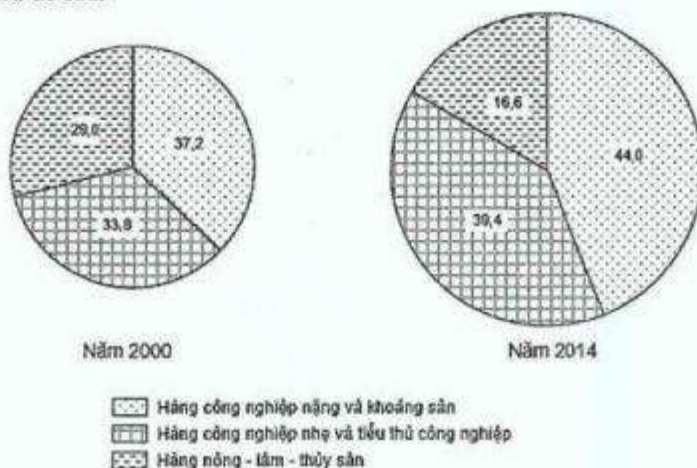
CƠ CẤU GIÁ TRỊ XUẤT KHẨU THEO NHÓM HÀNG, NĂM 2000 VÀ 2014 (%)

(Nguồn số liệu theo Sách giáo khoa Địa lí 12, NXB Giáo dục Việt Nam, 2015 và Niên giám thống kê Việt Nam 2015, NXB Thống kê, 2016)