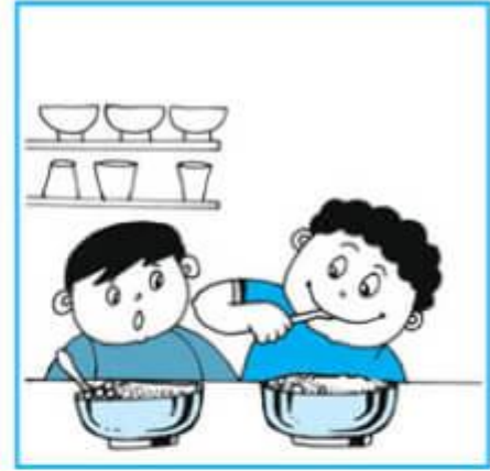
Buổi trưa : ăn cơm