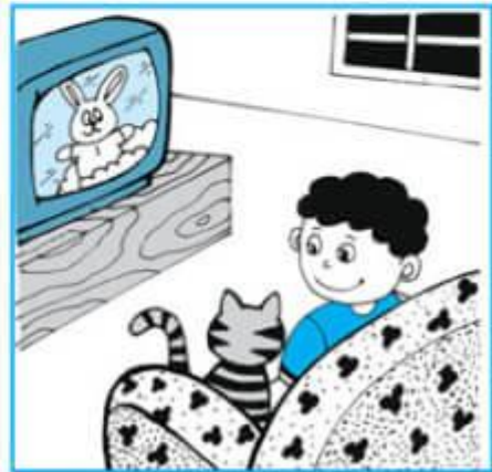
Buổi tối : nghỉ ở nhà