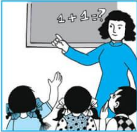
Buổi sáng : học ở trường