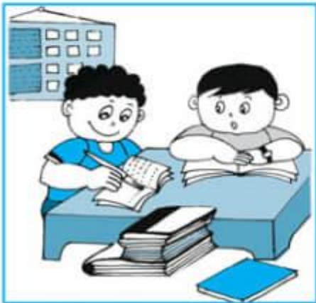
Buổi chiều : học nhóm